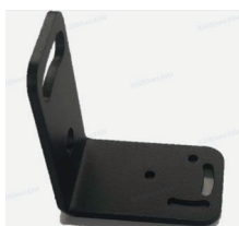
Крепежная пластина с винтами